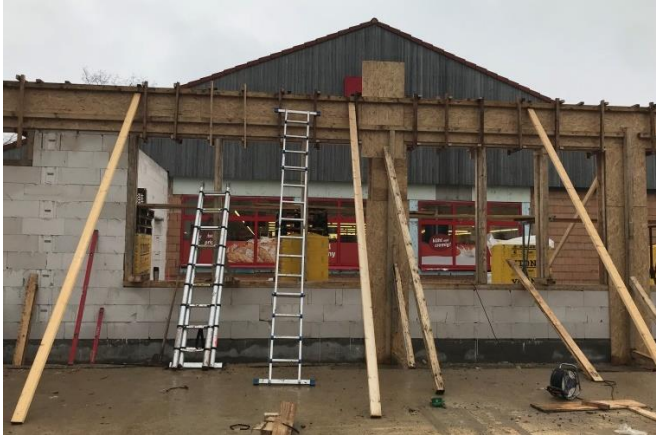
Schalung der Ringanker und Stützen