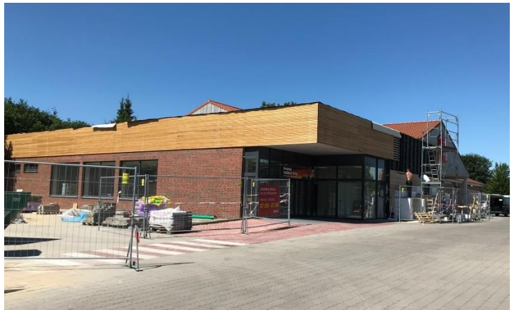
Anbau Penny Markt Lütjensee- Außenansicht