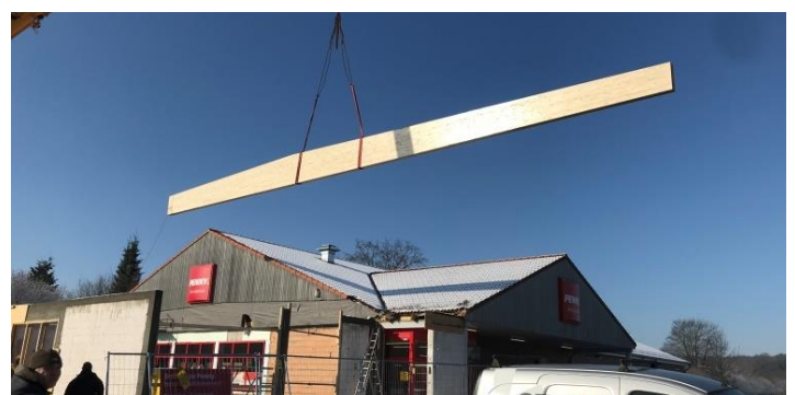
Montieren der Leimholzbinde der Dachkonstruktion