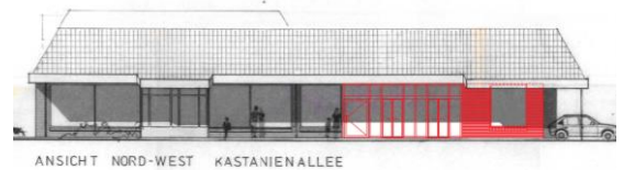
Ansicht zu Vorhaben zu Penny Uetersen