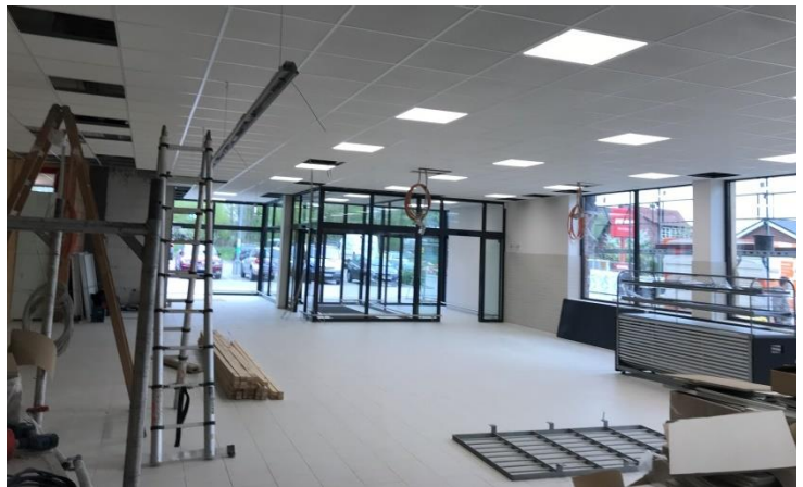
Anbau Penny Markt Lütjensee- Innenansicht