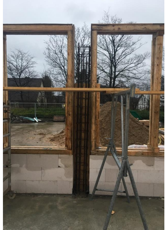
Fenster vor dem Schütten des Betons