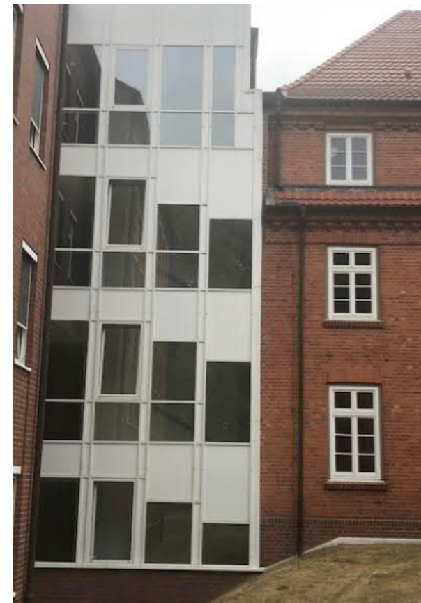
Neu erstellter Aufzugschacht