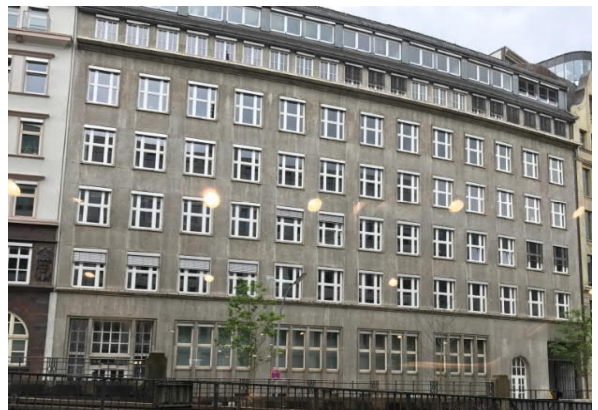
Fassadenansicht Mönkedamm 9