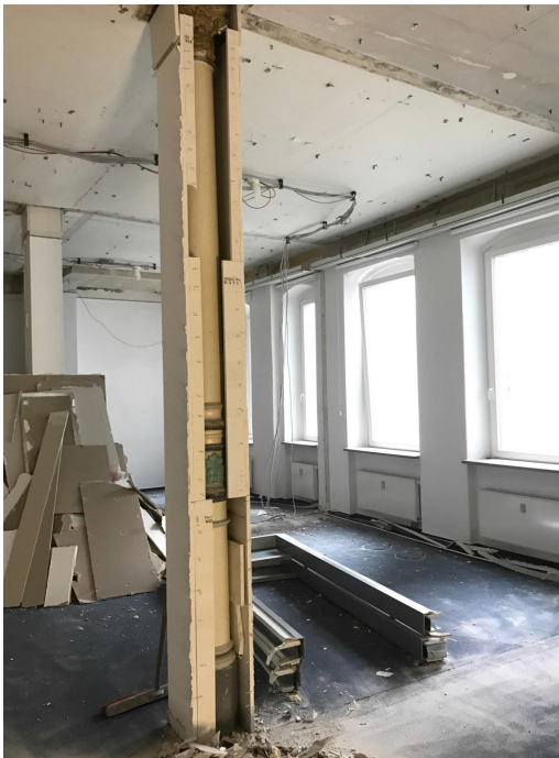
Gusseiserne Stütze vor der Sanierung