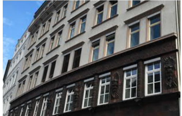
Fassadenansicht Mönkedamm 11