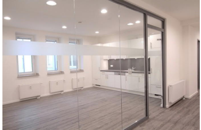
Pantryküche mit Glaswand zur Trennung von Büroflächen