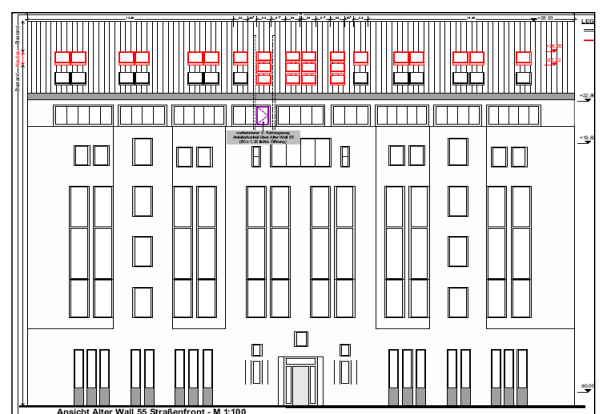
Fassadenansicht Alter Wall 55