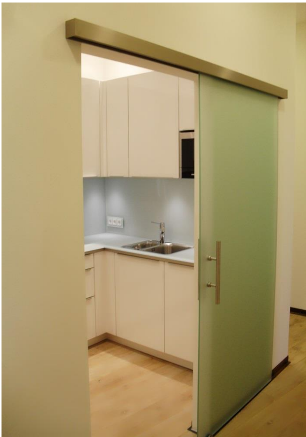
Fertige Pantryküche mit neuer Schiebetür