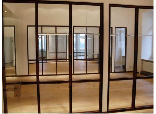
Nach Errichtung der Glaswände