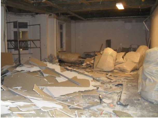
Beginn der Umbauarbeiten