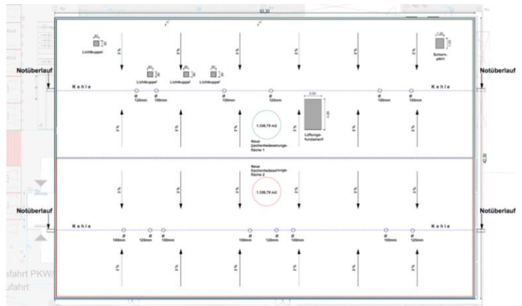
Dachaufsicht (ca. 2.650 qm) mit neuen Entwässerungsflächen