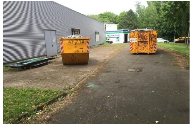
Außenbereich und Gebäude vor Sanierung