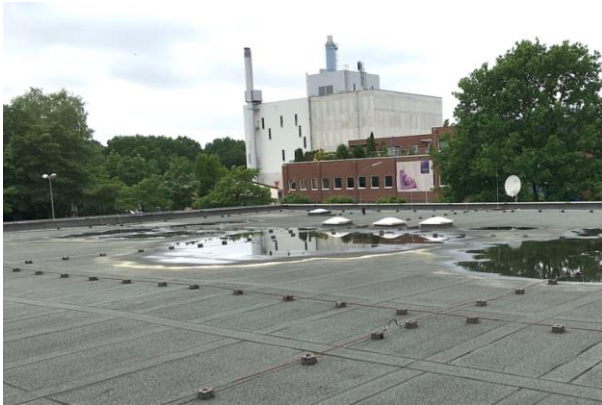
Dach vor Sanierung mit Absackung