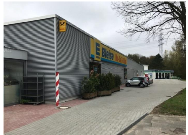
Neu hergerichteter Außenbereich mit und Gebäude mit neuer Attika