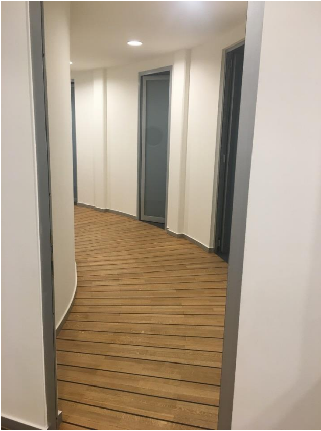
Flur mit Echtholzparkett