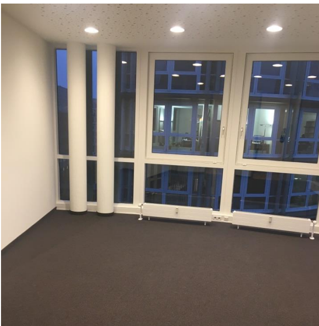
Bürofläche mit Velourboden