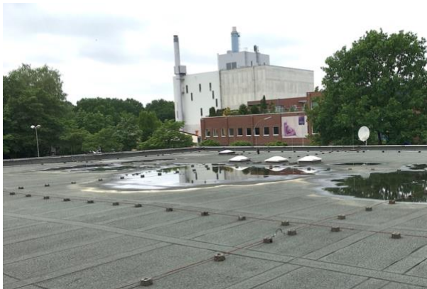
Dach vor Sanierung mit Absackung