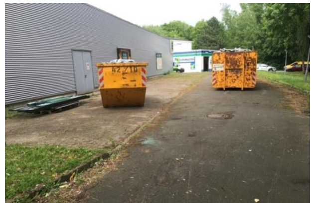
Außenbereich und Gebäude vor Sanierung