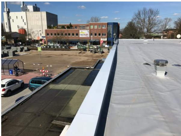
Dach mit neuer Entwässerung während der Sanierung im laufendem Betrieb