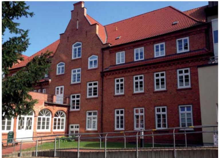
„Lutherhaus“ - Stift Betlehem

Damit investierte das Land Mecklenburg in einen umfangreichen Umbau, der durch seine Anpassung an einen modernen Neubau, sowohl den Patienten als auch den Beschäftigten des Krankenhauses, Vorteile bringen sollte. Hierfür wurde nicht nur der Innenraum vollständig saniert (einschl. Fenster, Türen und Geschossdecken), sondern auch ein zusätzlicher Aufzug außerhalb des Bestandes angebaut. Dieser Anbau wurde von uns in enger Zusammenarbeit mit dem Amt für Denkmalschutz, denkmalgerecht geplant und umgesetzt, woraus sich, hinsichtlich des Brandschutzes, ebenfalls eine neue Raumplanung ergab.